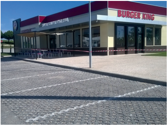
Parking - Caldas da Rainha

ARRUAMENTOS SEPARADORES PARKINGS JARDINS