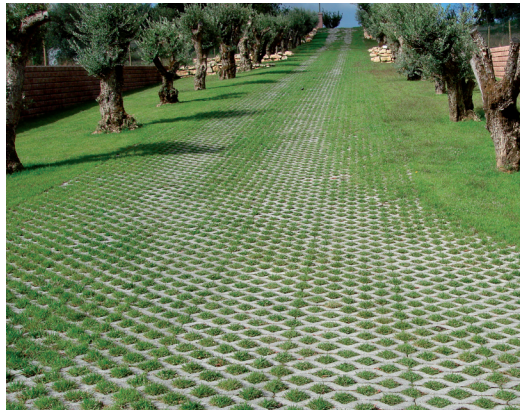
Arruamento - Pombal