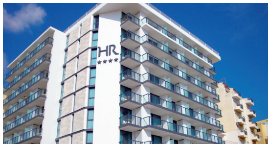
Hotel Rocha - Portimão

EDIFÍCIOS DE HABITAÇÃO, COMÉRCIO OU SERVIÇOS.