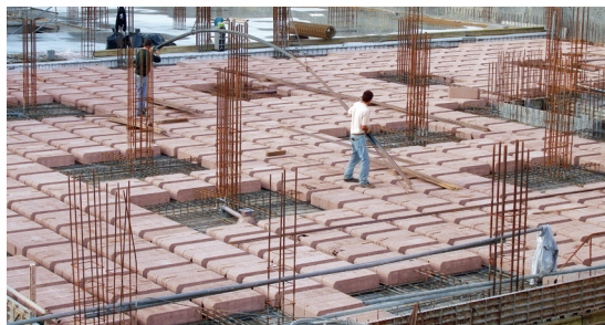
Edifício Multifamiliar - Viseu

COMPORTAMENTO SÍSMICO MELHORADO E BAIXO PESO