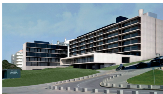
Domus Aqua - Vila Nova de Gaia