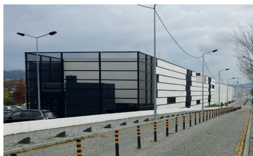
Escola Superior de Tecnologia - IPCA Barcelos