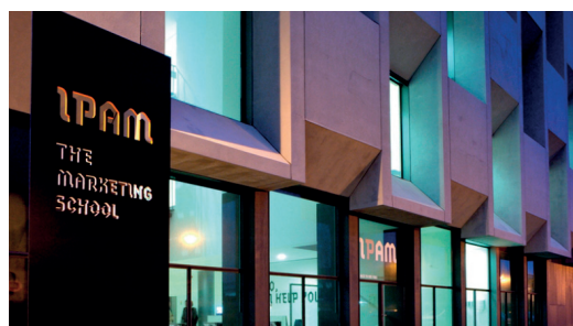
Edifício IPAM - Porto

OPTIMIZAÇÃO DO ISOLAMENTO TÉRMICO COM SISTEMA ETICS.