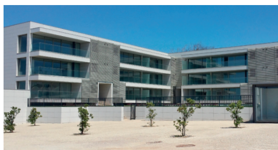
Edifício Portus Cale - Vila Nova de Gaia