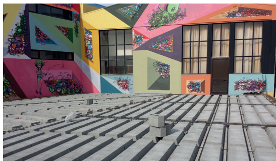
CR Estrela do Bonfim - Póvoa de Varzim

EM CADA FIADA DE PALETE, SÃO FORNECIDAS PEÇAS COM FUNDOS TAPADOS, PARA MAIOR ECONOMIA DE BETÃO.