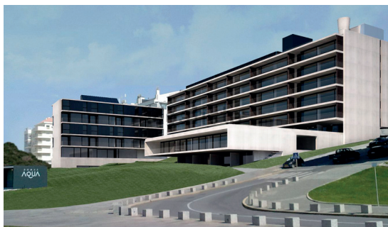
Domus Aqua - Vila Nova de Gaia