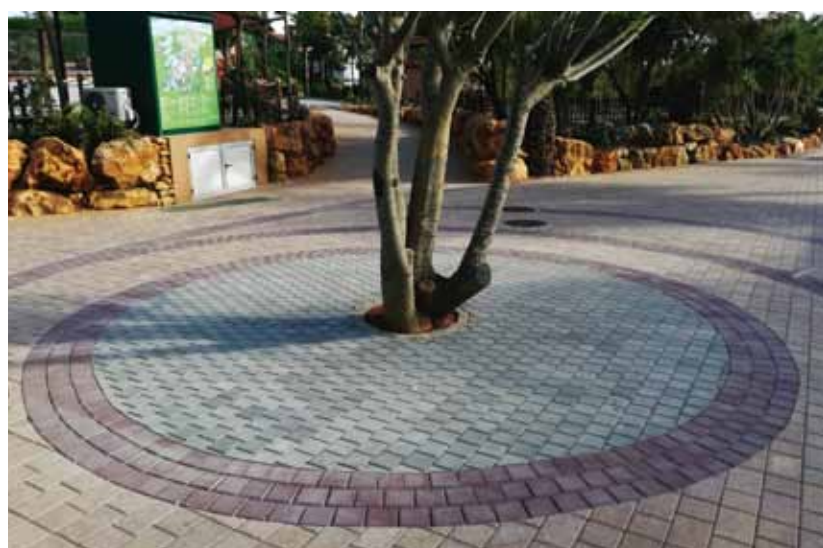
Cinza e Bordeaux - Zoomarine - Algarve

O QUADRADO é um pavimento de betão vibro-prensado de dupla camada, com apenas 4cm de espessura, e por isso com grandes vantagens logísticas , já que é possível transportar mais m 2 por carga.