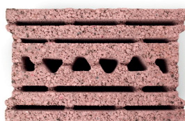
Topo Isoargila 25

Bloco alveolado em betão leve de agregados de argila expandida Leca, com um elevado e regulamentar desempenho acústico (RRAE 54dB) , constituindo, assim, uma alternativa a soluções de parede dupla , dispensando o recurso a outros materiais subsidiários.