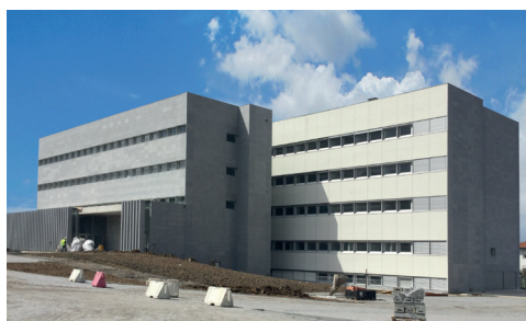
Bom Jesus - Braga

Bloco alveolado em betão leve de agregados de argila expandida Leca, com um elevado e regulamentar desempenho acústico (RRAE 54dB) , constituindo, assim, uma alternativa a soluções de parede dupla , dispensando o recurso a outros materiais subsidiários.