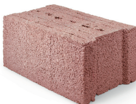
Base Isoargila 25