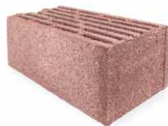
Bloco Topo Liso

As paredes exteriores simples, constituem o universo de utilização do TERMISOBEL® artebel, sendo este um bloco para uso exclusivo de isolamento térmico pelo exterior.