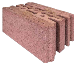
Base Isoargila 30