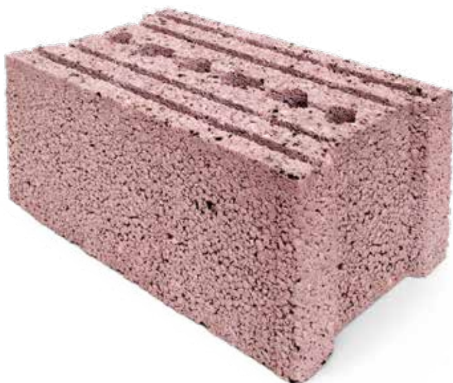
Topo Isoargila 25