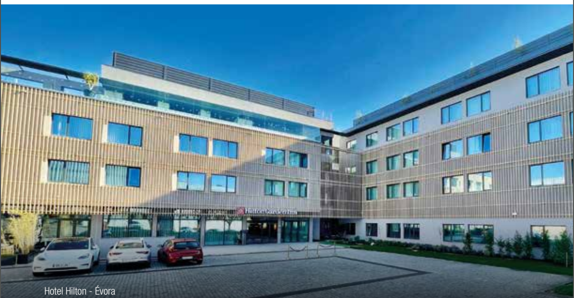
Hotel Hilton - Évora