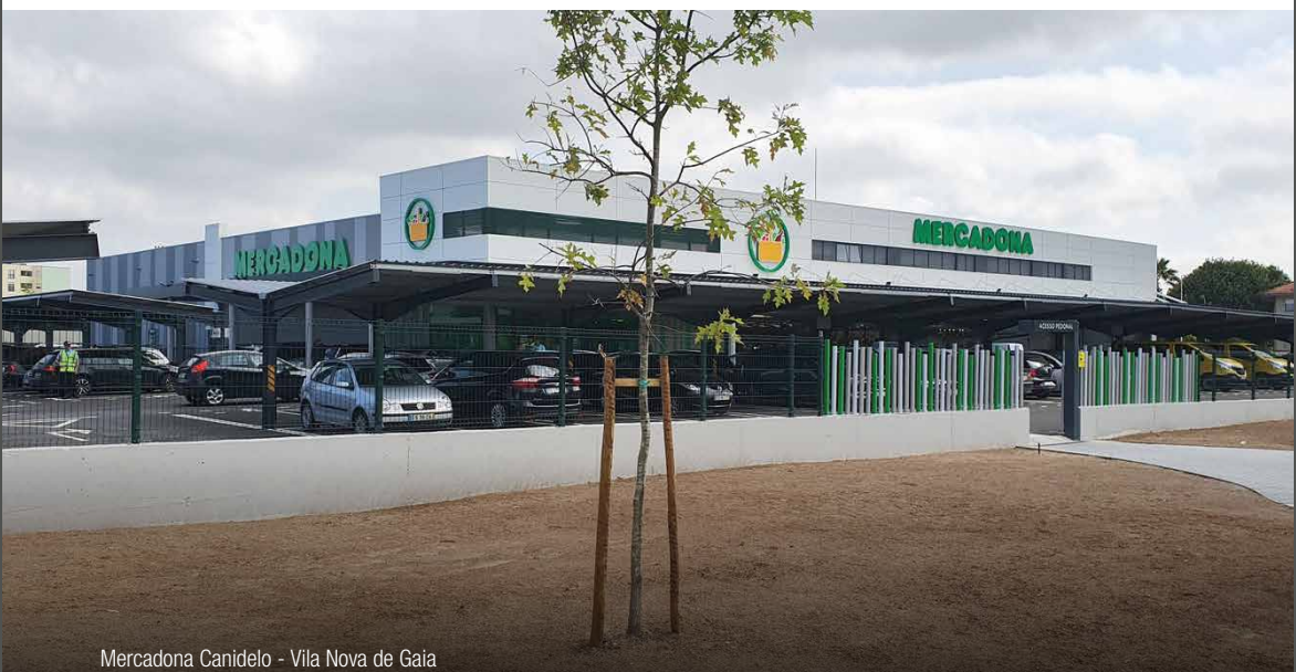
Mercadona Canidelo - Vila Nova de Gaia