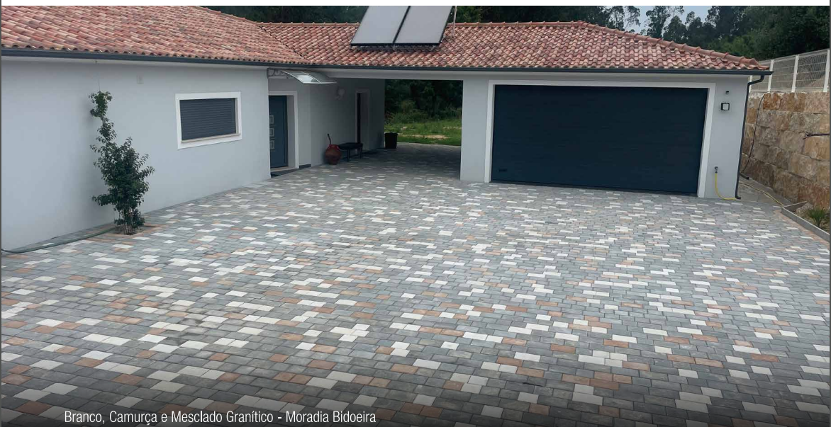
Branco, Camurça e Mesclado Granítico - Moradia Bidoeira