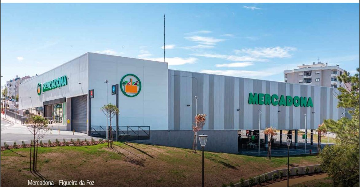
Mercadona - Figueira da Foz