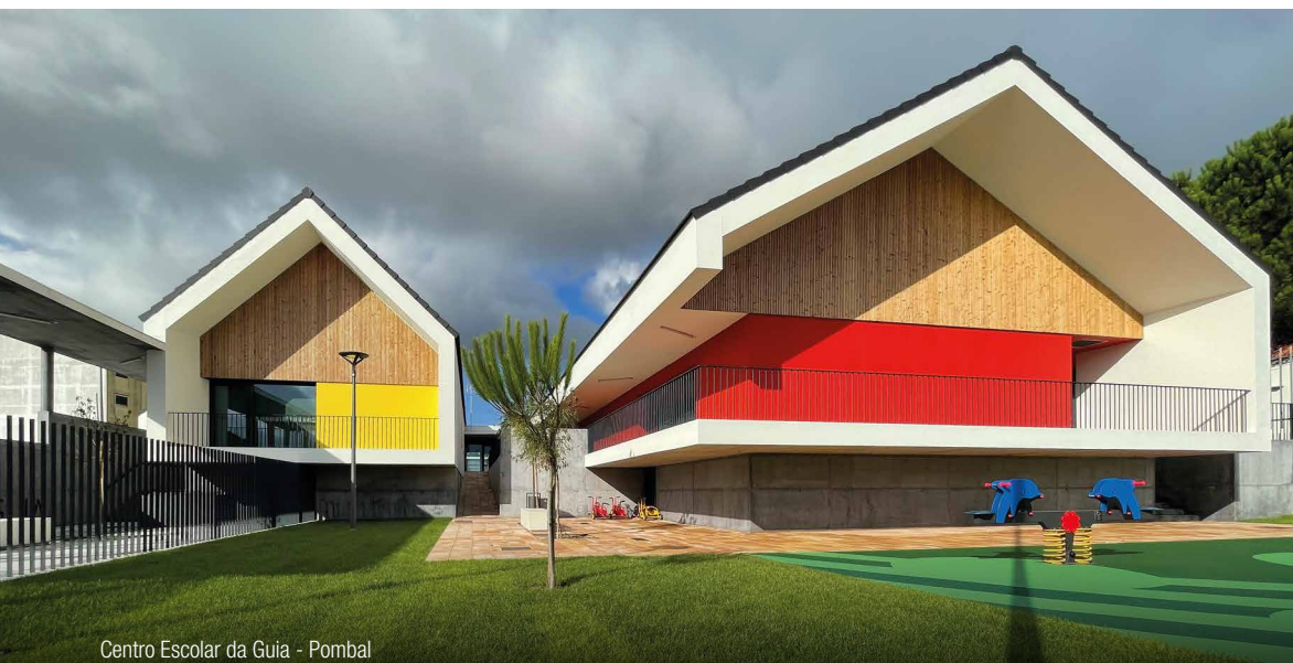
Centro Escolar da Guia - Pombal